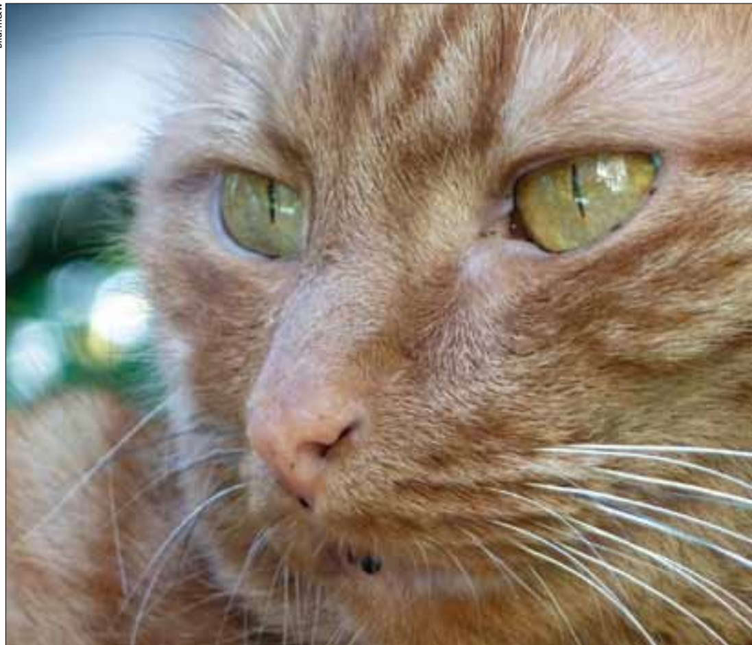
Sieht gefährlich aus, ist aber ganz lieb: Gegen Schmusekater kann doch kein Vermieter einen Einwand haben!

ter und Tier Rechnung. Viele Vermieter wollen die Haltung eines Hundes oder eines Büsis nämlich deshalb nicht zulassen, weil sich diese sozusagen in einem rechtsfreien Raum bewegt. Wenn sie einmal Ja zu einem Tier gesagt haben, ist unklar, welche Regeln gelten. Hier kann der Vertragszusatz des IEMT Abhilfe schaffen. Er legt klare Regeln fest, die nicht nur den Interessen von Mietern und Vermietern Rechnung tragen, sondern auch der artgerechten Tierhaltung.