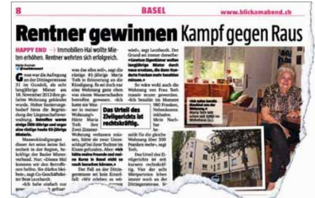
So berichtete der «Blick am Abend» über den erfolgreichen Kampf der Basler Miet-Seniorinnen gegen den drohenden Rausschmiss.

In der Industriezone in Genf gibt es eine Arbeiterbeiz, die günstige Mahlzeiten anbietet. Sie wird von den Beschäftigten der umliegenden Betriebe frequentiert. Nun kam die Vermieterin, eine Brauerei, auf die Idee, der Beiz auf Ende Januar 2013 zu kündigen, um dort ein gehobenes Restaurant zu installieren. Begründung: Im Quartier hätten sich Luxusuhrenfirmen wie Patek-Philippe, Rolex und Vacheron-Constantin niedergelassen. Man wolle nun einen Gastrobotrieb, der dieser Umgebung besser entspreche. Daraus entwickelte sich ein Streit. Das Mietgericht schützte die Kündigung, doch das kantonale Gericht hob sie wieder auf. Der Fall ging nach Lausanne ans Bundesgericht. Die-