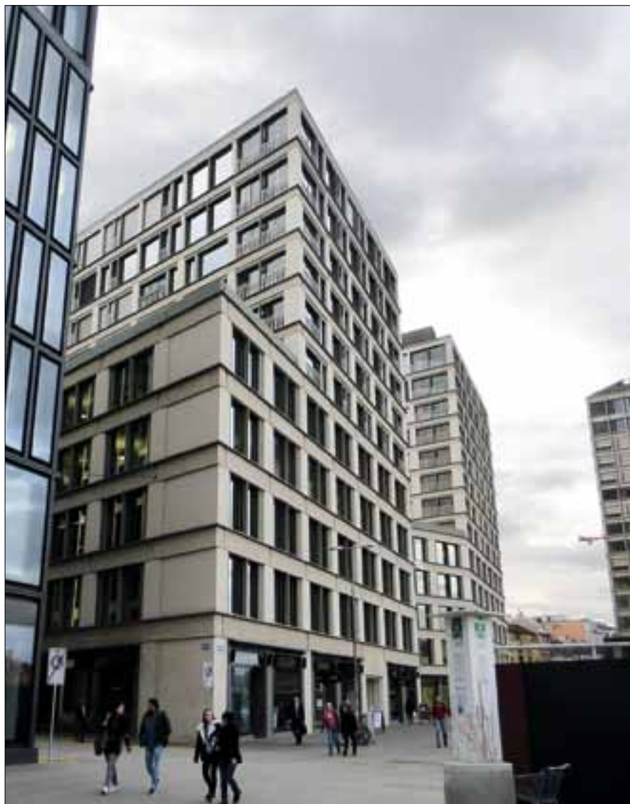
An der Europaallee beim HB Zürich reiht sich ein Geschäftshaus ans andere. Die maximale Ausnützung erlaubt hohe Renditen.