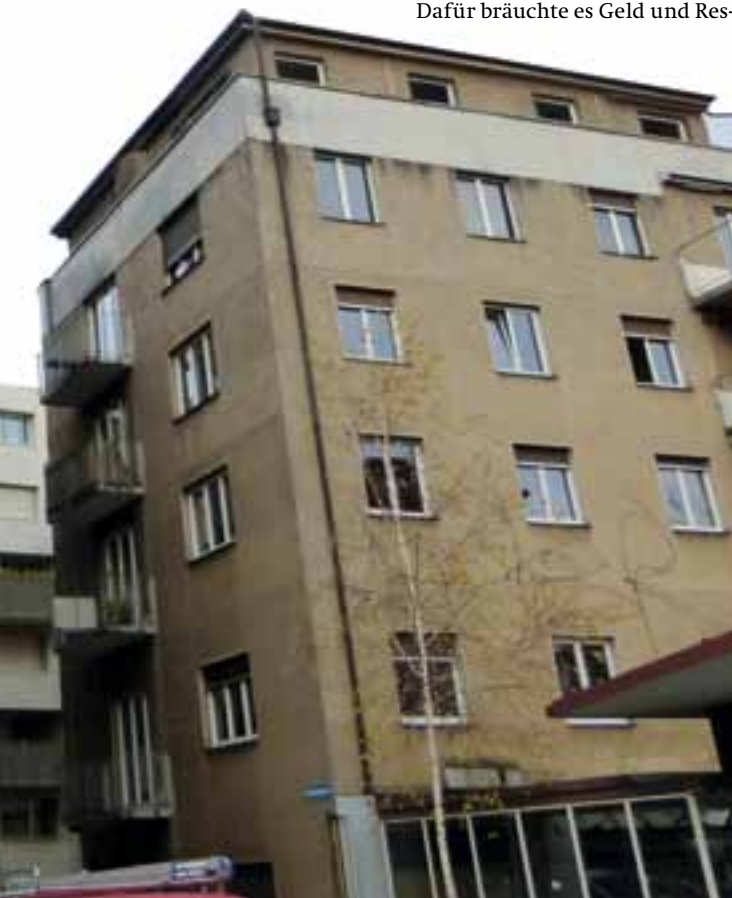
Mietende Wucherzinsen zahlen. Wie lange noch?

Ist eine solche Kooperation zugunsten der am meisten Benachteiligten auf dem Wohnungsmarkt denkbar? Wieso nicht? Es braucht eine Koalition zwischen Stadt, privaten Vermietern und Gemeinnützigen. In den Quartieren könnten Raum- oder Wohnbörsen eingerichtet werden. Man könnte viel erreichen, wenn man soziale Netzwerke aufbaut und den Verwaltungen die Möglichkeit gäbe, auf einen Sozialdienst zurückzugreifen, wenn Nachbarschaftskonflikte geschlichtet werden müssen. Ich bin überzeugt, dass man auf diesem Weg auch die soziale Durchmischung erhalten und stärken könnte.