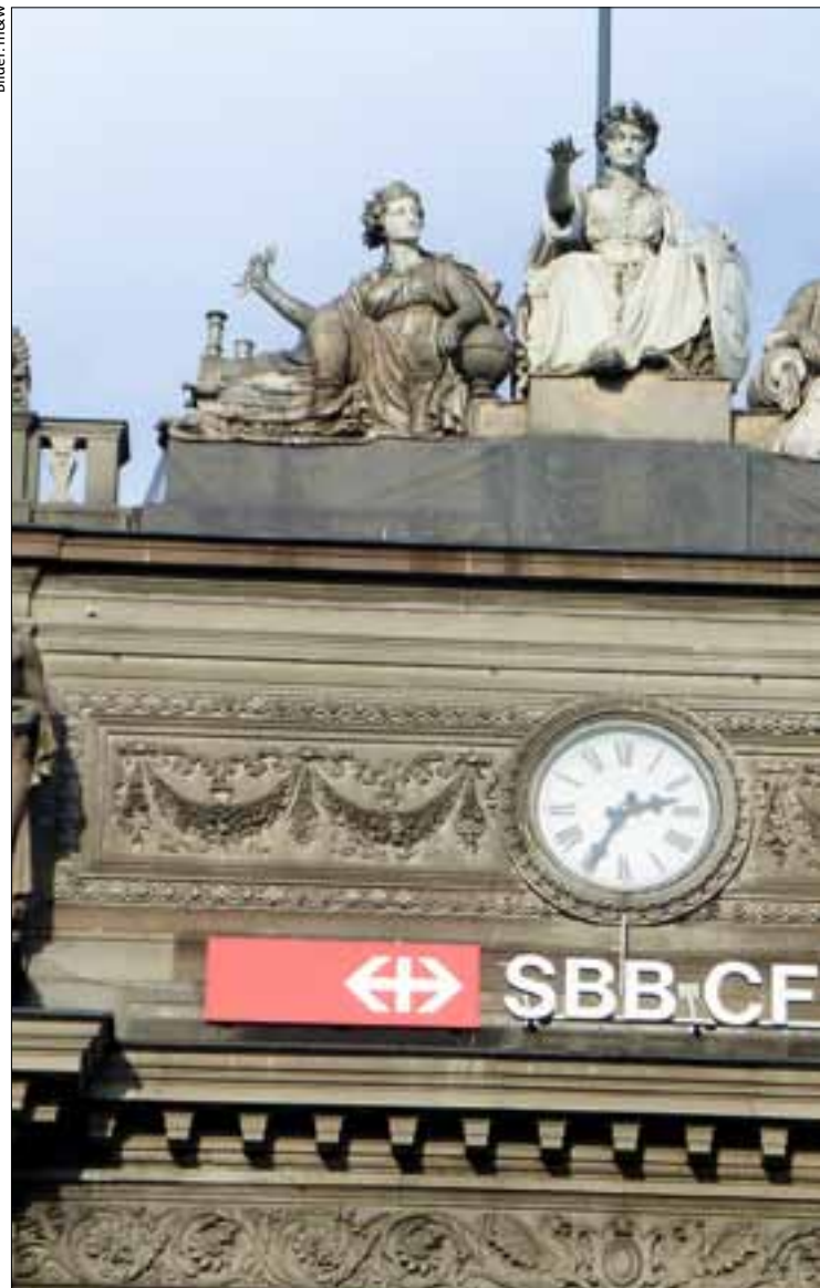
Eisenbahnkönig Alfred Escher (1819-1882) kaufte noch Grundstücke billig. Heute vorwiegend Geschäftshäuser.