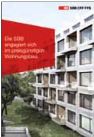
Ein SBB-Flyer informiert über den Wohnbau – aber wie?