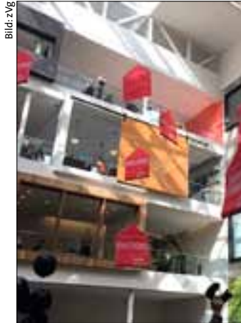
Protestaktion in der Zentrale von Airbnb in San Francisco.

Der Mieterverband von San Francisco (San Francisco Tenants Union) warnt schon lange vor den Folgen der Privatzimmerver-