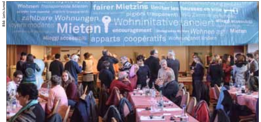
Klare Botschaften an der Generalversammlung des Dachverbands SMV in Bern.

In Holland wird der soziale Wohnungsbau durch eine Abgabe der Arbeitgeber finanziert. Rund ein Drittel der Wohnungen gehören sozialen Vermietern wie Genossenschaften oder anderen Institutionen. Privatvermieter