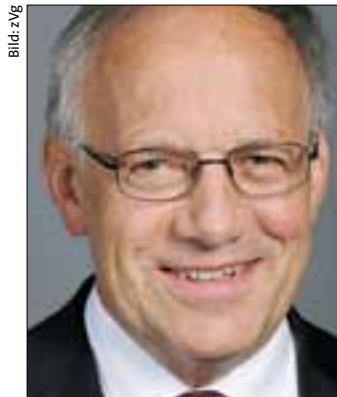
Nichts kann seinen Marktglauben erschüttern: Bundesrat Schneider-Ammann.

Die Mietenden können also «so wenig wie möglich» vom Bundesrat erwarten. Der fürs Mietwesen zuständige Magistrat glänzt durch Passivität, während die Mieten im ganzen Land selbst bei Tiefstzinsen munter weiter steigen und Familien und