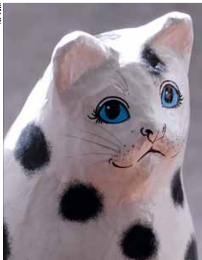
Diese Katze kann kein Vermieter verbieten (Seite 12).