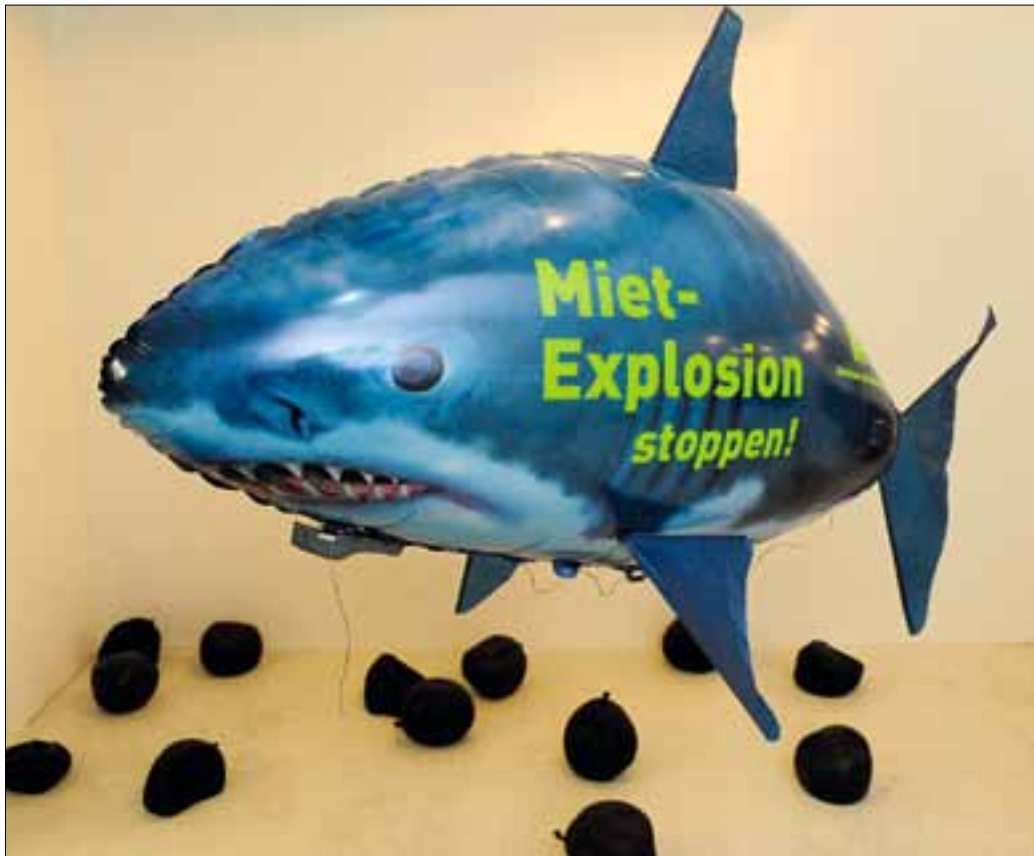
Statt auf Miethaie schießt sich der Hauseigentümergebiet auf transparente Mieten ein. Warum bloss?