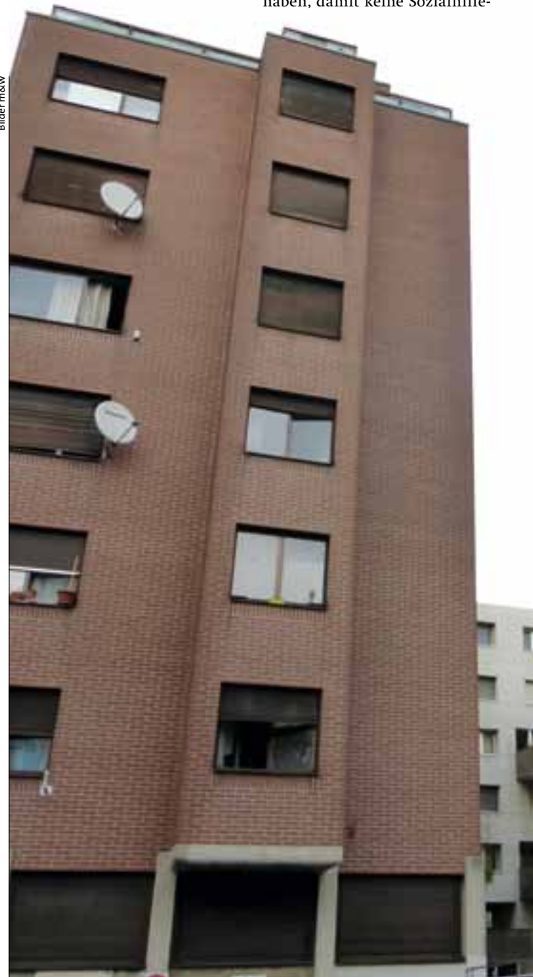
In diesen beiden Lotterliegenschaften im Zürcher Kreis 4 müssen sozial schwache

Die Frage ist, mit welchem Ziel die Sozialbehörden einschreiten. In der Praxis sehen wir, dass es den Behörden nicht in erster Linie um die Verbesserung der Wohnverhältnisse der betroffenen Mieterinnen und Mieter geht. Sie möchten die sogenannten Problemliegenschaften weg haben, damit keine Sozialhilfe-